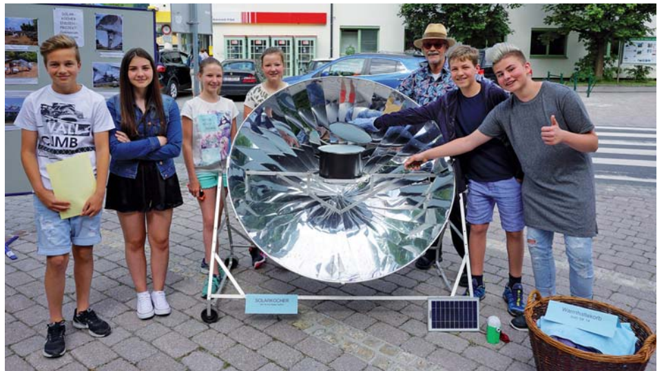
Am Tag der Sonne gab es Würstel aus dem Solarkocher, zubereitet von Schülern des Gymnasiums.