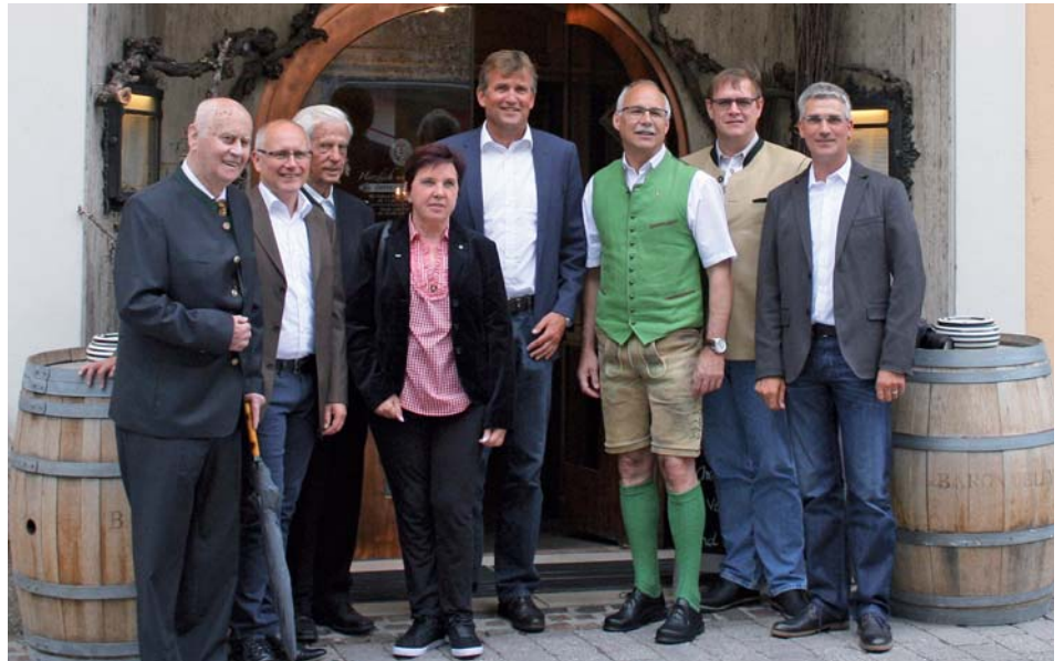
Die Delegation aus Lage war auch beim Bezirksfest vertreten.

Strobl. Viele Gäste aus Lage verbrachten bereits ihren Urlaub in St. Johann. Das 40-jährige Jubiläum der freundschaftlichen Städteverbindung wurde mit dem Besuch einer Delegation in Lage und einem Gegenbesuch beim Bezirksfest in St. Johann gefeiert.