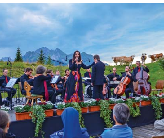
Eine beeindruckende Atmosphäre mit schönen Klängen bietet der Konzertabend am Berg.

Täglich bis 8. Oktober von 9 bis 17 Uhr und am 21./22. Oktober Wochenendbetrieb www.alpendorf.com