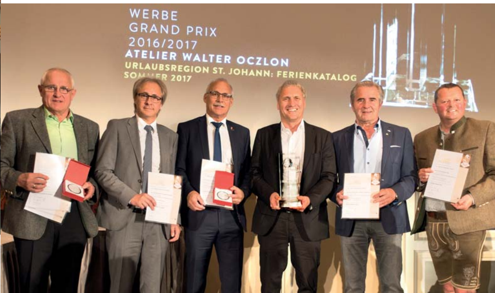
Strahlende Gesichter bei der Verleihung in Wien.