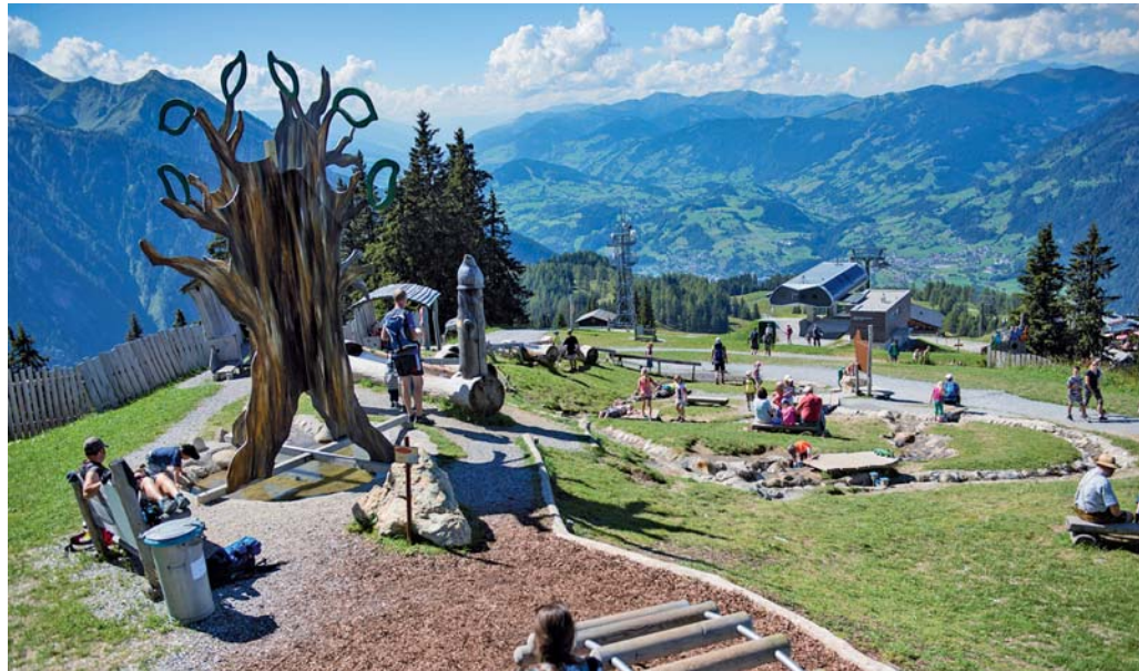
Tauchen Sie ein in das Reich der Geister und genießen Sie eine atemberaubende Aussicht.

Die Strecke führt von der Talstation Gondelbahn bis zum Sternhof, danach über den Wanderweg zur Kreistenalm, weiter über den Kniebeißer mit Teilpassagen von 35 % Steigung zur Obergassalm und schließlich bis zum Ziel bei der Gernkogelalm. Auf der 7,5 km langen Strecke ist eine Höhendifferenz von 1.015 Höhenmetern