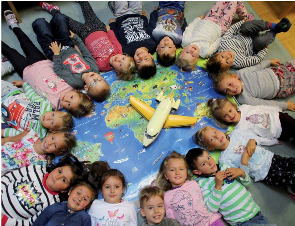
Das Integrationsprojekt macht einfach Freude.

Schon im Herbst wurden Bräuche und Traditionen der unterschiedlichen Heimatländer der Kinder mit Hilfe ihrer Eltern erklärt, Spiele und Lieder aus anderen Ländern ausprobiert. Eine Mutter hat den Kindern z.B. Spezialitäten aus ihrem Heimatland zubereitet. So wurden verschiedene Anlässe gefeiert, wie Erntedank (Österreich), Hl. Martin (er kommt aus Ungarn), Hl. Nikolaus (er kommt aus der Türkei) usw. Die