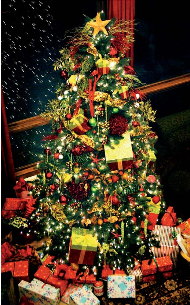
Wie umweltverträglich ist IHR Weihnachtsfest?

Weihnachten ist das Fest des Lichts. Christbaum- und Adventkranzkerzen sollen die langen Nächte rund um die Weihnachtszeit etwas erhellen. Immer moderner wird die elektrische Weihnachtsbeleuchtung. Aus jedem Fenster erstrahlt ein Stern, ein Weihnachtsmann, ein Baum o.ä. Die Stromanbieter danken es Ihnen.