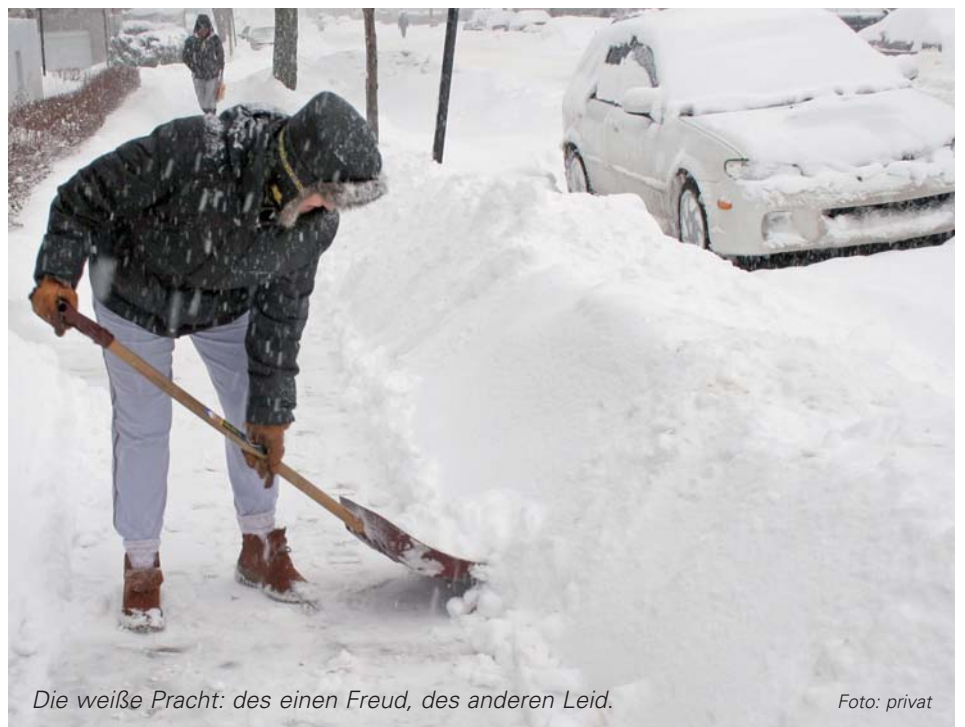
Die weiße Pracht: des einen Freud, des anderen Leid.

der Straßenrand in einer Breite von einem Meter zu räumen. Sollten in Ausnahmefällen (aus arbeitstechnischen Gründen) bestimmte Teilstücke von Gehsteigen und Gehwegen sowie öffentliche Privat- und Interessentenstraßen vom Winterdienst der Gemeinde mitbetreut werden, wird ausdrücklich darauf hingewiesen, dass diese Arbeiten durch die Gemeinde eine freiwillige Leistung darstellen aus denen kein Rechtsanspruch abgeleitet werden kann und die damit verbundene zivilrecht-