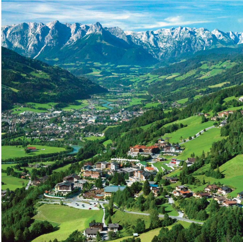
Eine herrliche Landschaft, sehr gute Tourismusbetriebe und ein vielseitiges Angebot im Sommer und Winter machen St. Johann auch in Krisenzeiten zu einem attraktiven Urlaubsort.

Die kommende Wintersaison ist schwierig einzuschätzen. Die Hauptbuchungszeit - Weihnachten/Silvester bzw. die Ferienzeit im Februar - ist wie immer stark nachgefragt. Positiv ausgewirkt auf das frühe