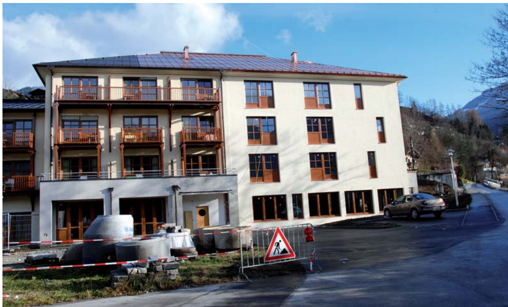
Kräftig investiert wird in den Erweiterungsbau des Seniorenheimes.

Im außerordentlichen Haushalt schlägt sich der Zubau des Seniorenheimes am stärksten zu Buche. € 2,5 Millionen werden dafür im neuen Jahr veranschlagt. Der südseitige Zubau ist bis auf den Innenausbau (Deckenbau, Maler-, Fliesen- und Bodenlegerarbeiten) fertig gestellt. Laut Zeitplan sollen die neuen Zimmer in diesem Bereich im Februar 2010 bezugsfertig sein. Die Arbeiten an der Außenanlage wurden noch im November abgeschlossen. Der Rohbau des neuen Haupteingangsbereiches wurde bereits errichtet. Im Winter können der Ausbau und die Innenadaptierungen vorgenommen werden.