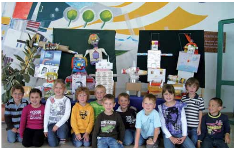
Die Kinder der 1b u. 3b Klasse nehmen es mit den Müllmonstern locker auf.

Ein nachahmenswertes Jahresthema - danke an alle Lehrerinnen.