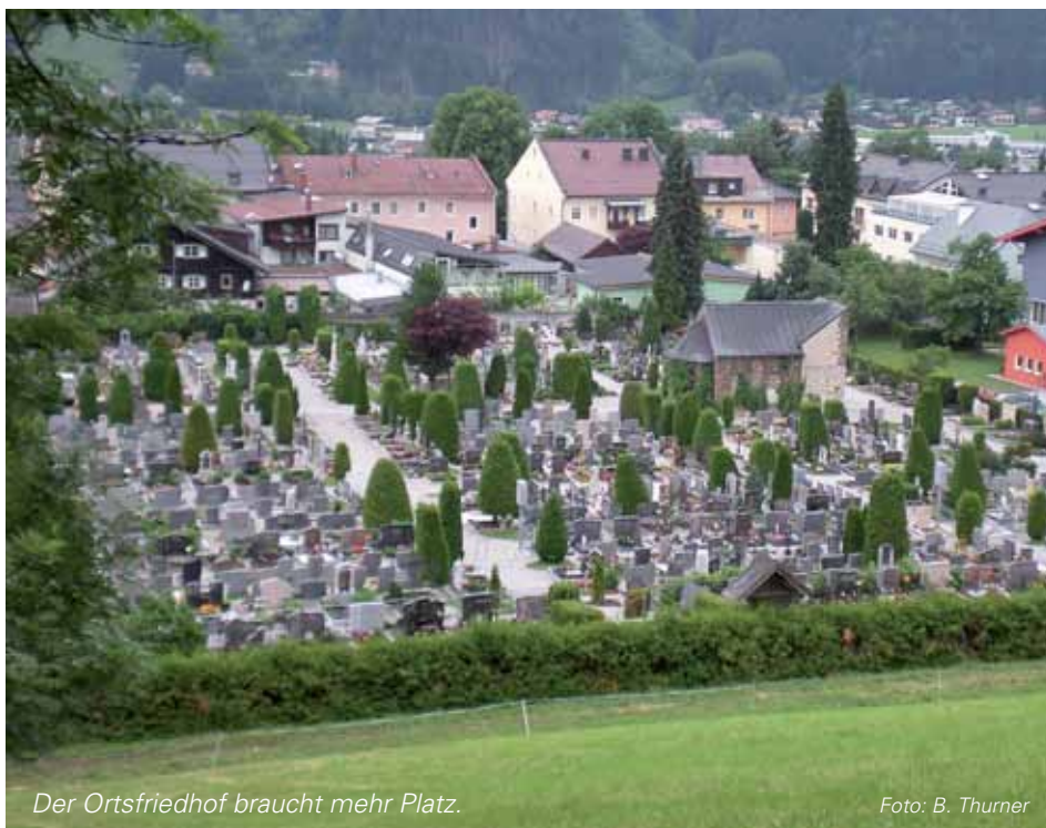
Der Ortsfriedhof braucht mehr Platz.

Die Bauarbeiten für die Vergrößerung des Friedhofes werden im Herbst beginnen.