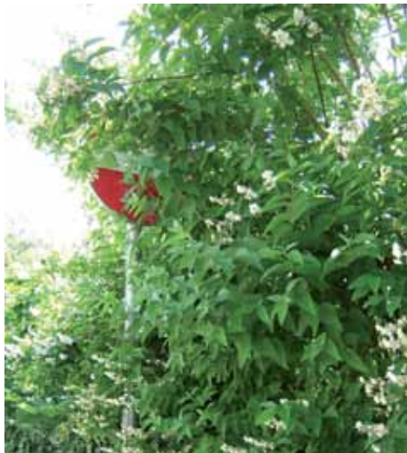
Hier ist die Sicht auf das Verkehrszeichen eindeutig beeinträchtigt.

Nicht nur Straßenverkehrsbehörden sondern auch LiegenschaftseigentümerInnen sind für die Verkehrssicherheit verantwortlich. Pflanzen verschönern zwar das Ortsbild, können aber auch Gefahrensituationen verursachen. Hecken, Sträucher und Bäume, die in den Verkehrsraum hinein-