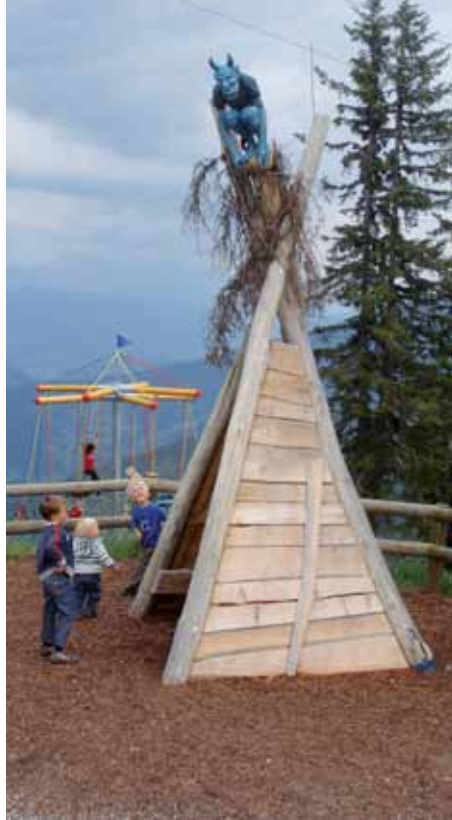
Der Geisterberg: ein beliebtes Ausflugsziel für Kinder und Erwachsene.

Um Verständnis für diese infrastrukturellen Maßnahmen werden alle Betroffenen ersucht.