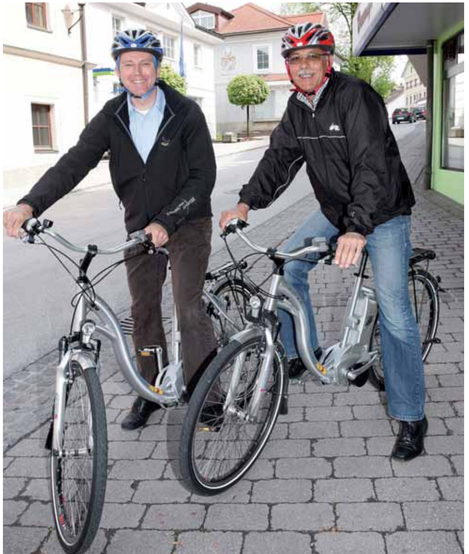
Landesrat Sepp Eisl und Bürgermeister Günther Mitterer lobten die Vorzüge des E-Fahrrades.

Die öffentlichen Abfallbehälter in Parks, bei Spazier- und Wanderwegen sind ausnahmslos nicht für Hausabfälle gedacht. Hausabfälle sind ausschließlich über die Restmülltonne bzw. über den Restmüllsack zu entsorgen.