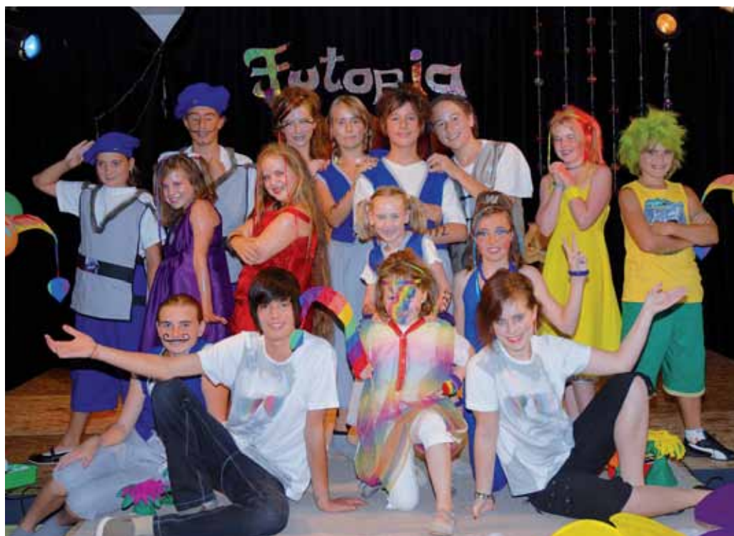
Letztes Jahr stand das fantastische Stück „Futopia“ auf dem Spielplan.