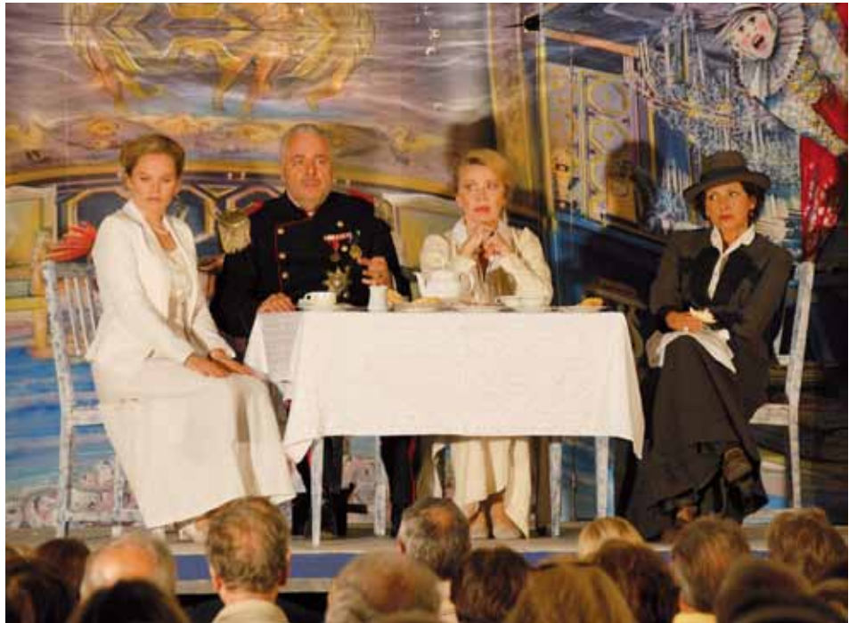
Ein fixer und sehr beliebter Bestandteil im St. Johanner Veranstaltungsprogramm: das Straßentheater.

Der Eintritt ist frei. Bei Schlechtwetter findet die Aufführung im Feuerwehrhaus statt.