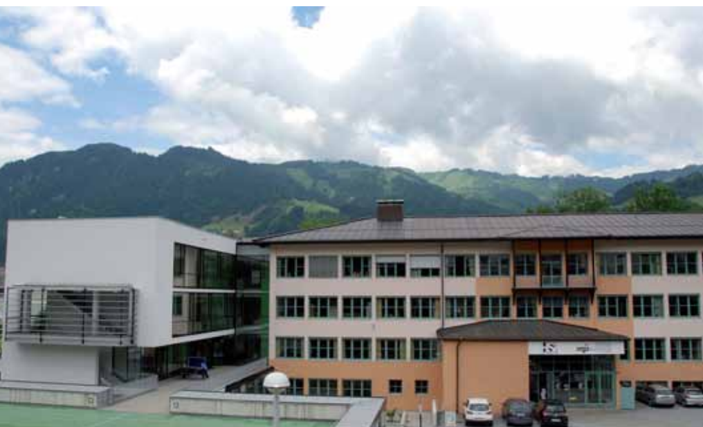
Schule braucht Raum – das ist mit dem modernen Zubau der Hauptschule sehr gut gelungen.

Diesen Spitzenplatz hat die Stadt hauptsächlich der konservativen und mit Weitblick bedachten Finanzpolitik der letzten Jahrzehnte zu verdanken. Viele Investitionen und Großprojekte konnten fast ausschließlich mit Eigenmitteln realisiert werden. Es mussten kaum Kredite aufgenommen werden. Eine sehr schlanke und effiziente Verwaltung sind die weiteren Ursachen. Anders hätten die steigenden finanziellen Belastungen nicht bewältigt werden können: 1999 hatte der ordentliche Haushalt einen Umfang von € 16,7 Mio., 2009 waren es € 24,6 Mio.