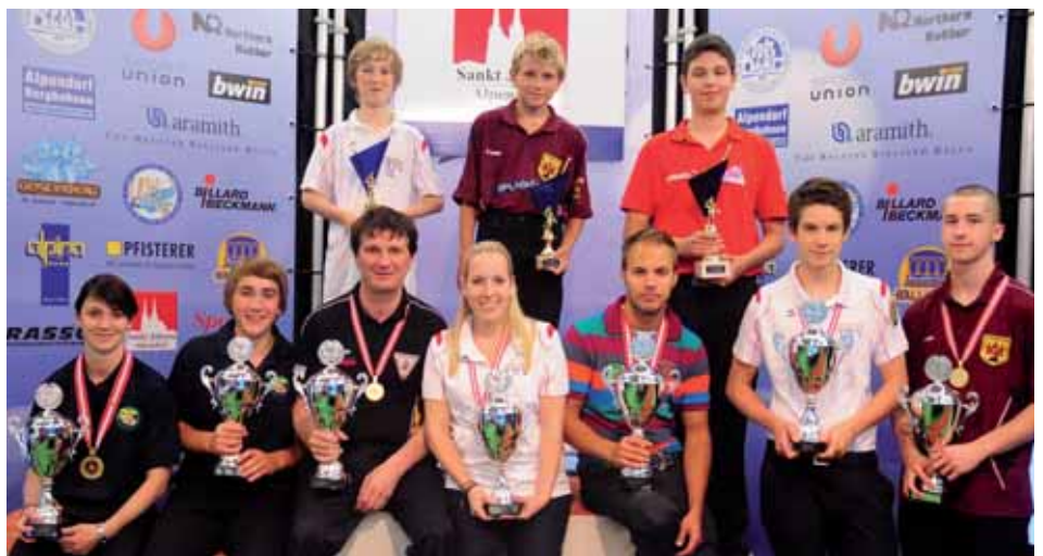
Das überaus erfolgreiche Salzburger Team sorgte für spannende Wettkämpfe in allen Disziplinen.