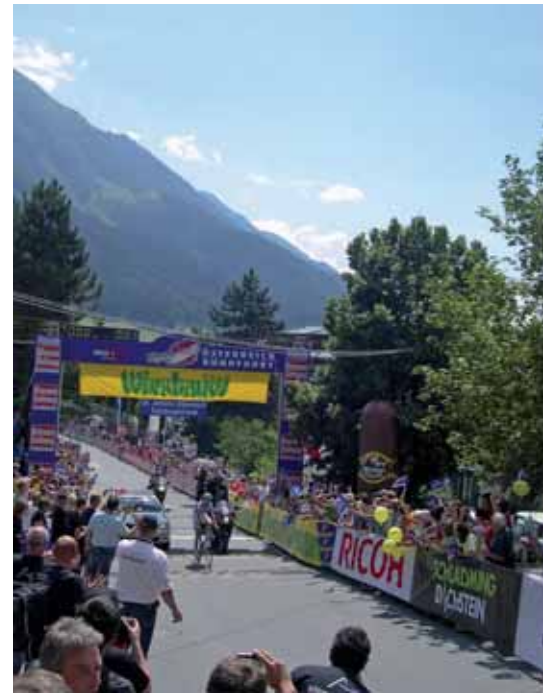
Spitzensport, Ausdauer, Topstimmung und herrliches Wetter – das waren die Zutaten der 4. Etappe der Österreich-Radrundfahrt.

Während der 5-stündigen Live-Übertragung im Fernsehen wurden eindrucksvolle Bilder der Königsetappe präsentiert. St. Johann – Alpendorf stand dabei im Mittelpunkt der Berichterstattung. Strahlendes Wetter, beste Bedingungen und ein gut organisierter Top-Event mit sportlichen Höchstleistungen sind eine unbezahlbare Werbung für die Region. 550 offizielle Funktionäre, Sportler und Begleitpersonen sowie 120 Presseleute haben sich am 6. und 7. Juli in St. Johann aufgehalten. Darunter auch so mancher prominenter Radsportfan, wie Andreas Goldberger. St. Johann hat sein gutes Image als professioneller Etappenort bestätigt. Den Veranstalter ist es gelungen, ein medienwirksames Top-Ereignis nach St. Johann zu holen und für einen erfolgreichen und gut organisierten Ablauf zu sorgen. Die nächste Österreich-Radrundfahrt kommt bestimmt ... vielleicht auch wieder nach St. Johann.