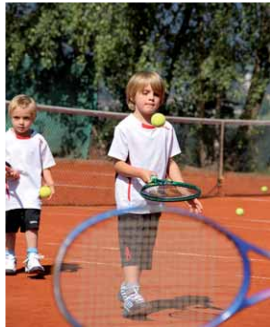
Große Talente fangen mal klein an: die Kids beim „Tennis for You“ im Alpendorf.

Viele Leute investieren viel Zeit und auch Geld, um für die St. Johanner Kinder die Sommerferien abwechslungsreich zu gestalten. Ein herzliches Dankeschön allen