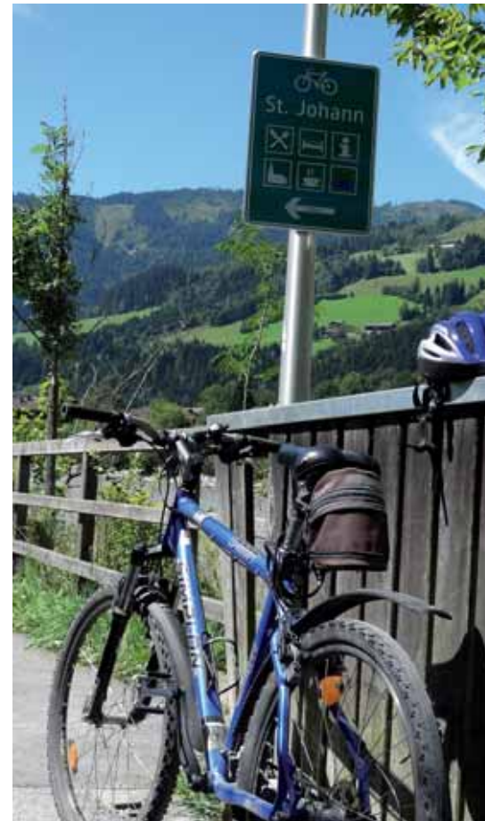
Umweltfreundlich unterwegs mit dem Mountainbike oder E-Bike.

Der Ankauf von Elektrofahrädern und Elektromopeds wird mit bis zu € 100,- gefördert.