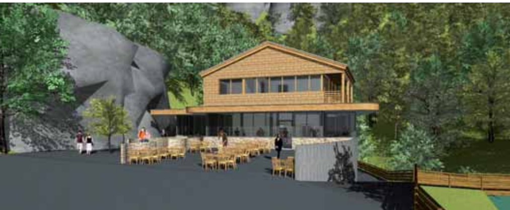
Naturnahe Materialien wie Holz und Naturstein dominieren und fügen sich architektonisch hervorragend in die Umgebung. Animation Architekt DI Gerhard Maier

Erleben auch Sie das imposante Naturschauspiel hautnah! Täglich geöffnet von 8 bis 18 Uhr, noch bis 2. Oktober 2011.